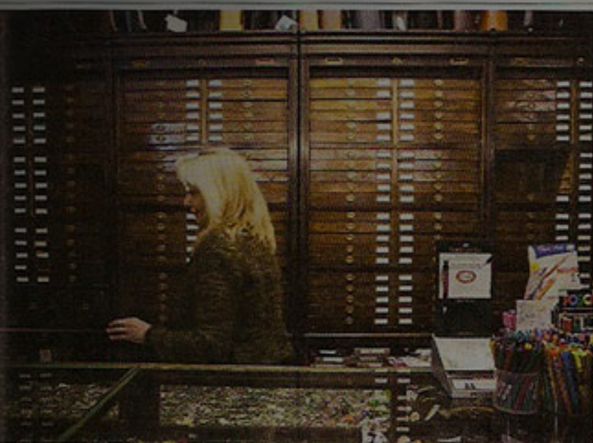
Podreu calçar com Greta Garbo i posar mirada de misteri.